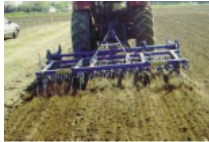
Figure 2. Reprise superficielle à l'aide d'une herse.